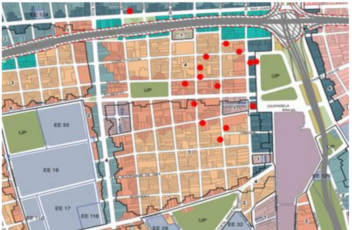
Relevamiento vecinal: Localización actual de metaleras y papeleras

Si bien la presencia de usos molestos o de difícil convivencia urbana es un desafío que afrontan diversos sectores de la ciudad, muy especialmente a partir de la desregulación de los usos del suelo (en forma de mixturas) propuesta por el actual Código Urbanístico; bregamos por la definición de una “mixtura de usos deseable” para nuestro barrio.